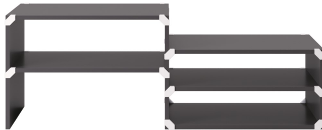
TABLE BASSE TIDY

Pour réaliser ce meuble, vous aurez besoin de :